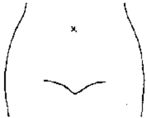
(ストマ及びびらんの部位等を図示)