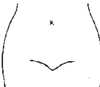
(腸瘻及びびらんの部位等を図示)