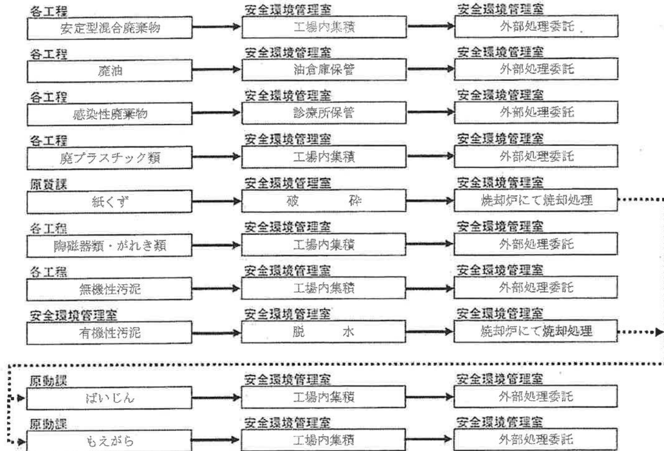
別紙① 産業廃棄物の一連の処理の工程