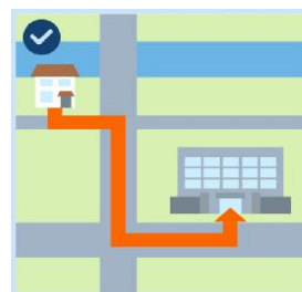
避難場所や 避難経路の確認