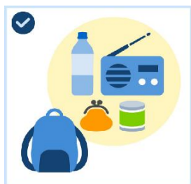
非常用 持ち出し袋の準備