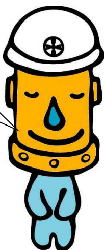
上下水道局マスコットキャラクター「カンちゃん」(水乃環太朗)

お問い合わせ先 秋田市上下水道局 ( 課 係 ) 担 当 TEL ( 昼 ) TEL ( 夜 ) ----- 施工業者 現場代理人 TEL