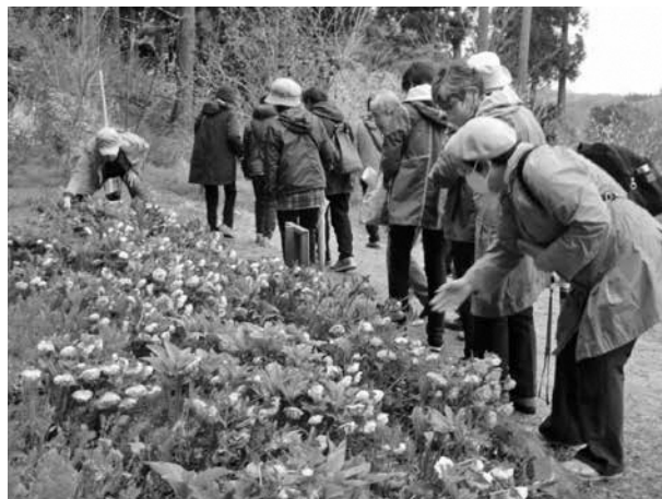
奨励員自主企画事業 珠林寺「クリスマスローズの里散策」