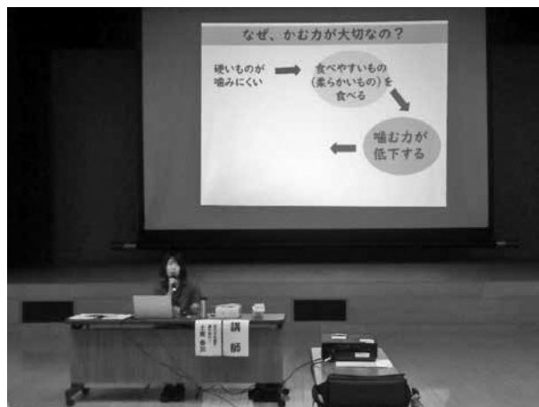
オーラルフレイルについて学びました