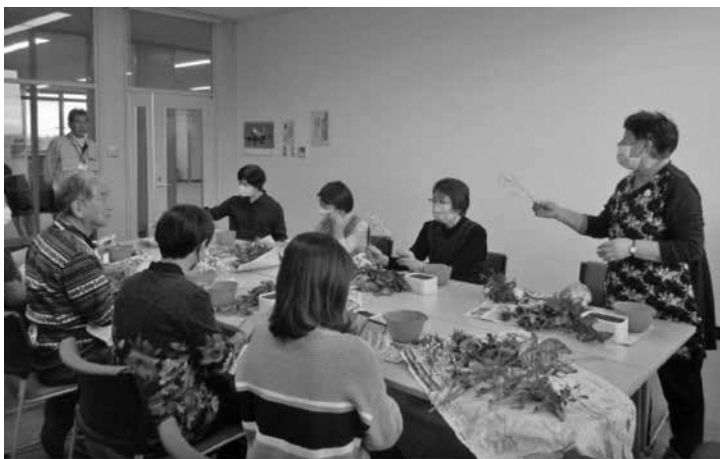
秋の彩り フラワーアレンジメント教室