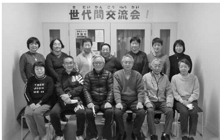
和気あいあいと活動しています！

今日はすべてが多様化し、人間の本来持つべき感性が薄れて行くような気がしてなりません。奨励員として、次代を見据え一人一人がみんな考えて、共に頑張つて参りたいと思います。