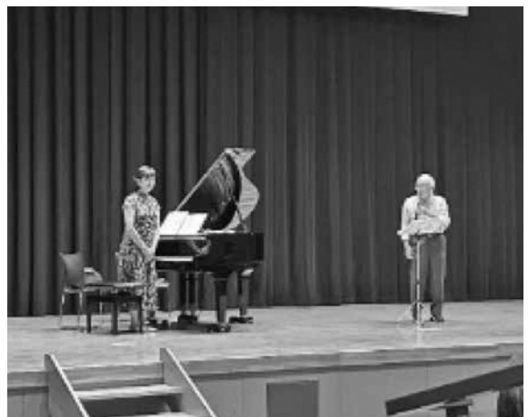
第9回みんなで歌おう (土崎地区生涯学習奨励員自主企画事業)