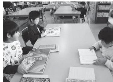
【学校図書館での読書】