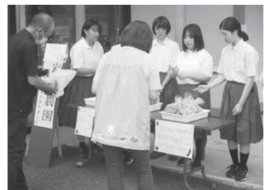
【栽培した野菜の販売】