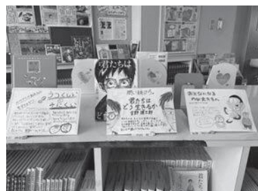
【子どもが選んだ本の紹介】