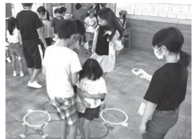
【異年齢交流活動の様子】