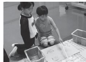
【児童と幼児の交流活動の様子】