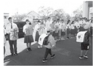
【小中合同あいさつ運動】

◇地域行事への合同参加など、児童生徒の交流活動のあり方について、学校運営協議会等で話題にし、保護者や地域の願いを生かす。