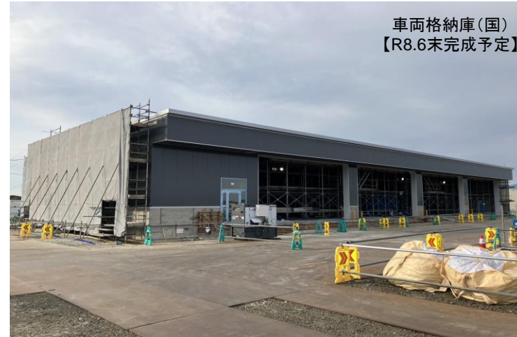
車両格納庫(国) 【R.8.6末完成予定】