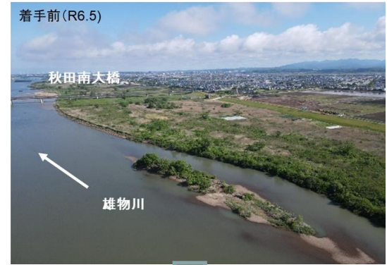
雄物川右岸(秋田南大橋付近)河道掘削状況写真