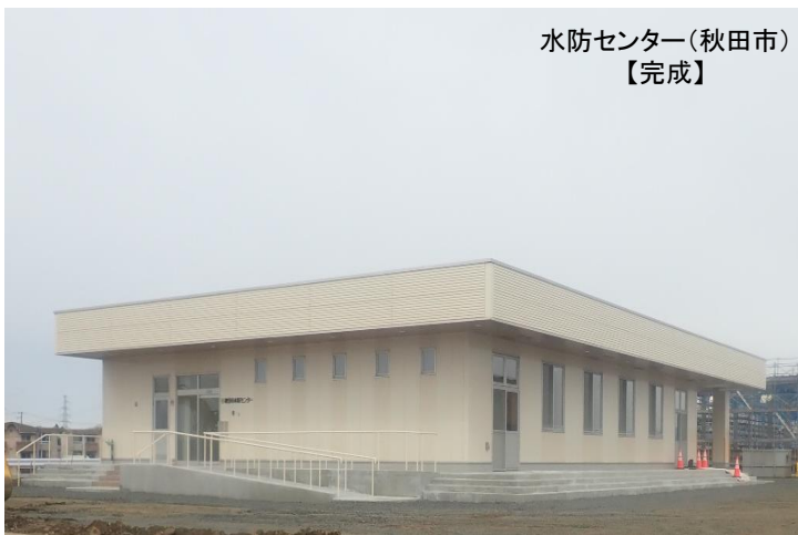
水防センター(秋田市) 【完成】