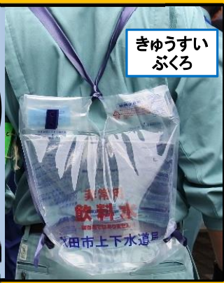
きゅうすい ぶくろ

ひとがいきっていくためには ひとりいちにち3リットルの みずがひつようなんだ! さいがいにそなえてせっち されている「おうきゅうきゅう すいせん」はとてもたいせつ なものなんだね!