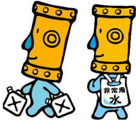
秋田市上下水道局 マスコットキャラクター 「カンちゃん」