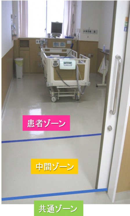
病室ゾーニングの1例