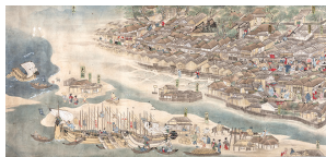
伝 荻津勝孝「秋田街道絵巻(上巻・土崎湊部分)」秋田市立千秋美術館蔵

歴史文化ラボは、「歩く」「学ぶ」「作る」をテーマに、秋田のまちを歴史文化の視点で紐解く研究室。生の三味線に乗せた民謡や、歴史文化が大好きな納谷さんのトークで「歴史と文化のおもしろさ」に触れてみませんか？