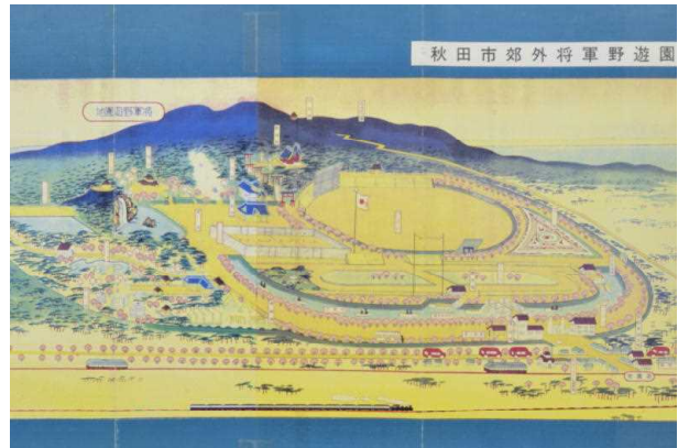
将軍野遊園地鳥瞰図

人気を博した将軍野遊園地ですが、戦争突入による時局の悪化で昭和20年に遊園地の敷地は帝国石油株式会社に譲渡され、その後閉園となってしまいます。