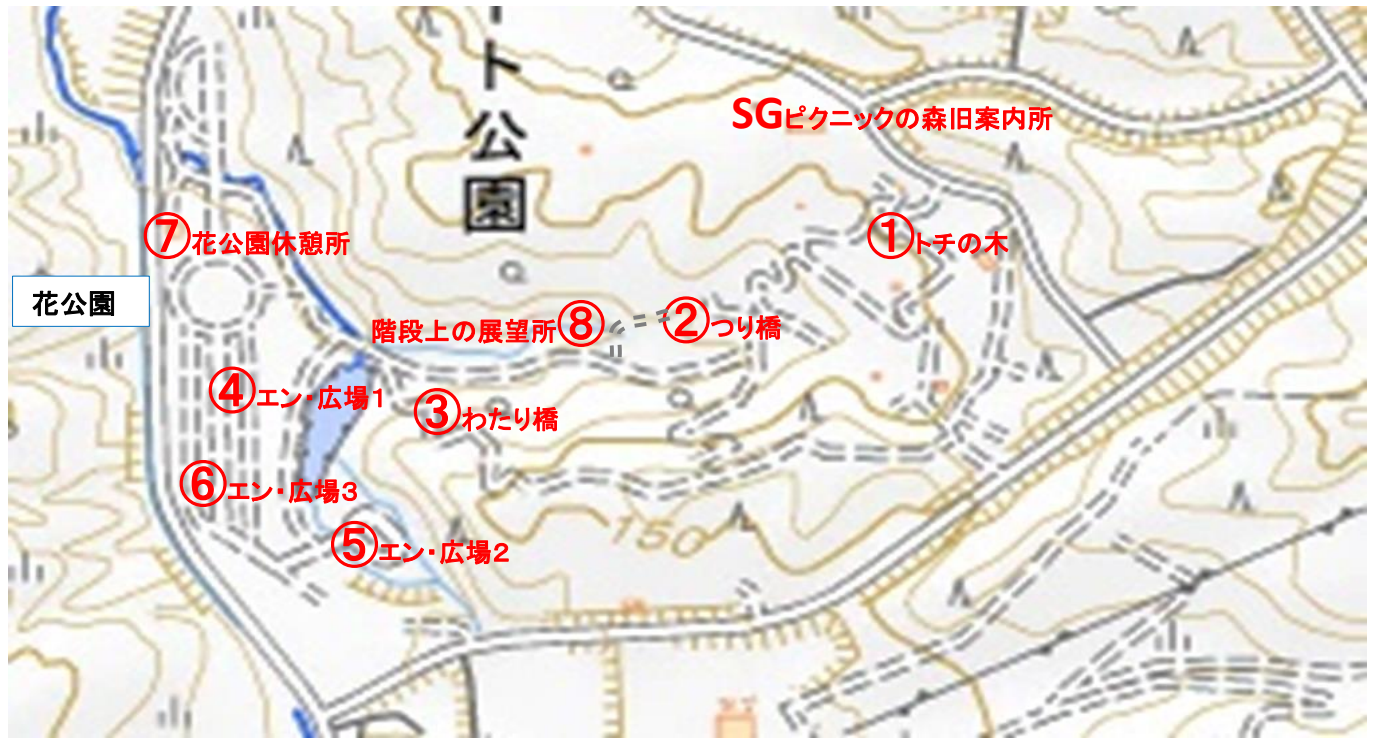
①トチの木(水飲み場が目印)