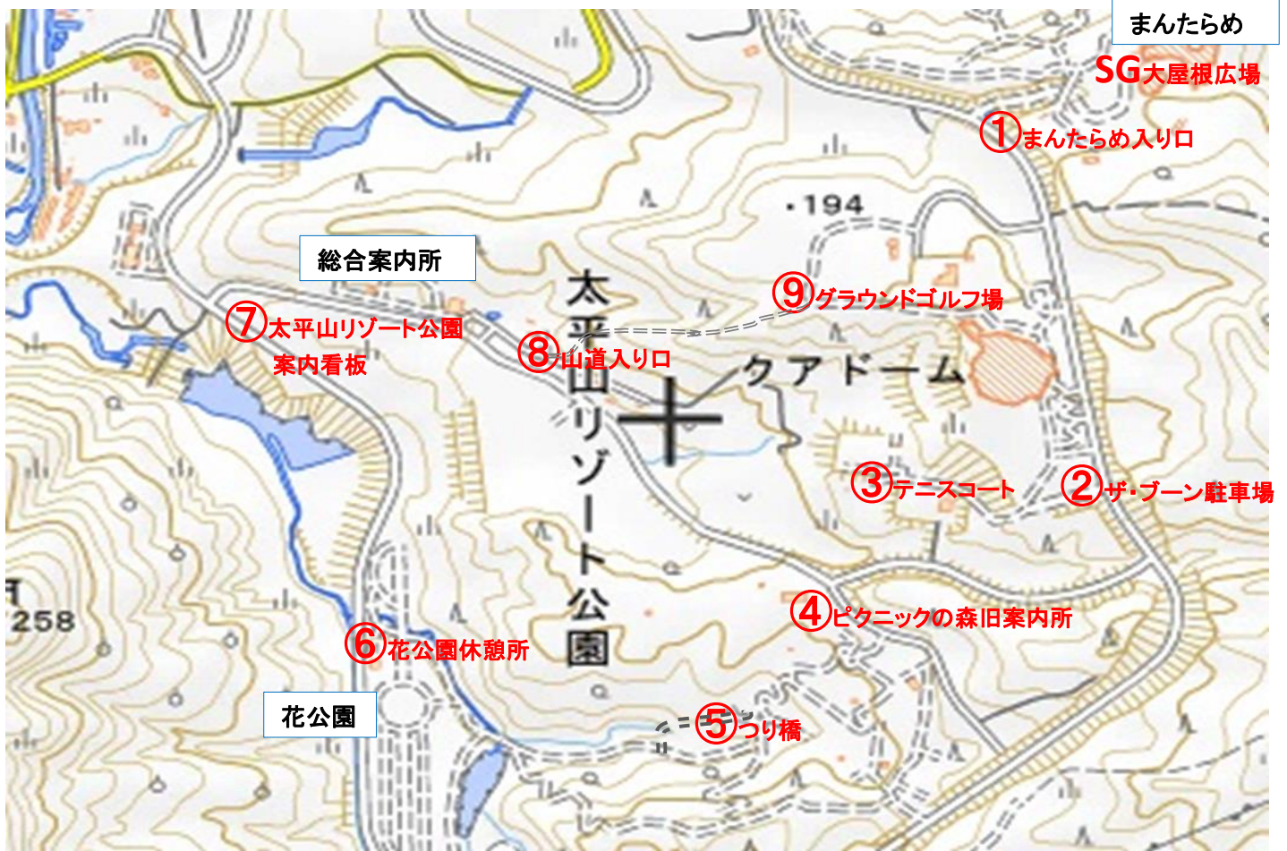
①まんたらめ入り口