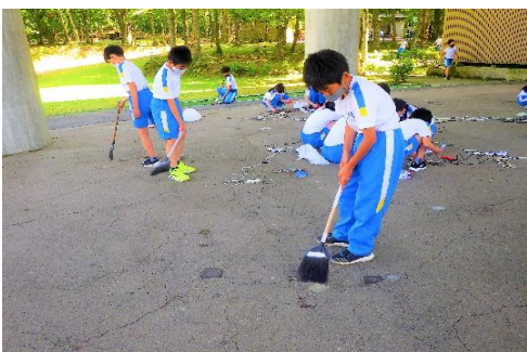
【共通】 使い終わった場所は、みんなできれいに掃除する。