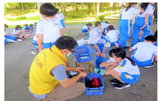
【共通】 使い終わった道具も、きれいにそろえて整とんする。