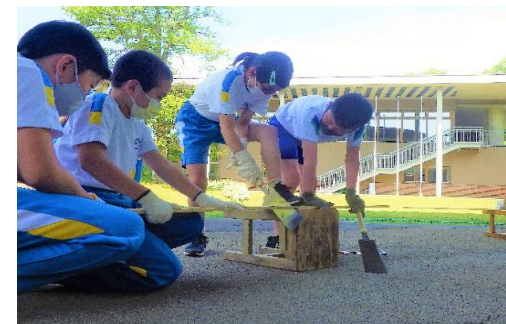
● 両刃のこぎりは目の細かい方で切る。グループで支え合い、協力する。