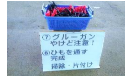
【共通】 作業の見通しを持たせるために、手順を可視化し、道具を準備する。