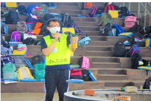
● ガスバーナーの操作方法を伝え、火傷を未然に防ぐ。