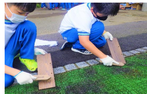
● 人工芝の上で板を金ブラシでこすり、木目に沿って下にすずを落とす。