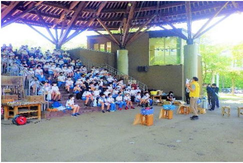
【共通】 児童を座らせ、手順や安全面の配慮を説明する。