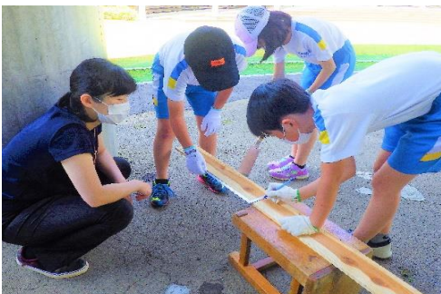
● 差し金を板にあてて、30cmずつ長さを測り、鉛筆で線を引く。