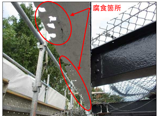
さび落とし後の状況(令和4年8月)