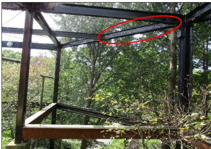
事前調査時(令和3年9月)