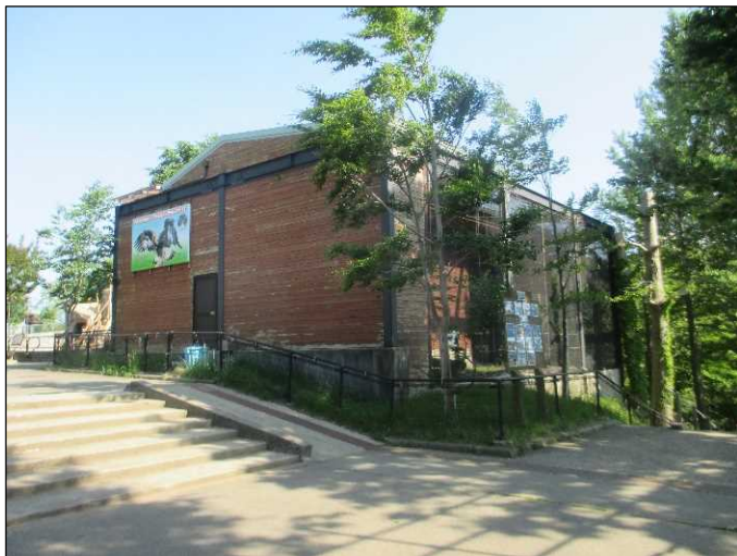
①猛禽舎改修工事前(北側)