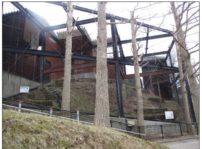
②猛禽舎改修工事前(西側)