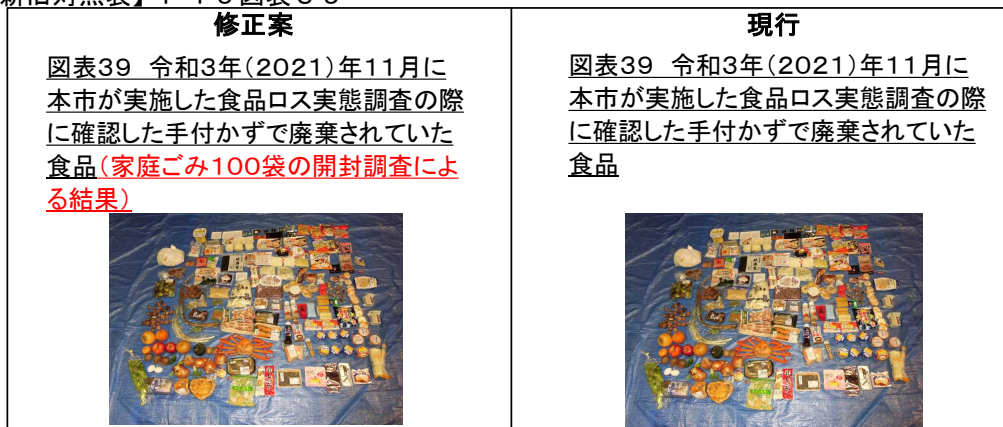
【新旧対照表】 P 1 9 図表 3 9