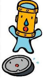
秋田市上下水道局 マスコットキャラクター 「カンちゃん」