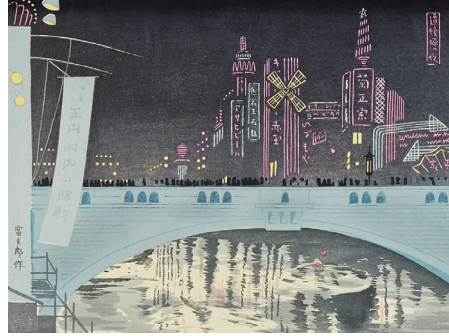
「道頓堀の夜景」徳力富吉郎