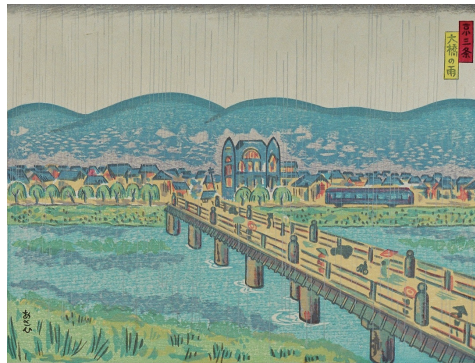
「三条大橋の雨」旭 泰宏