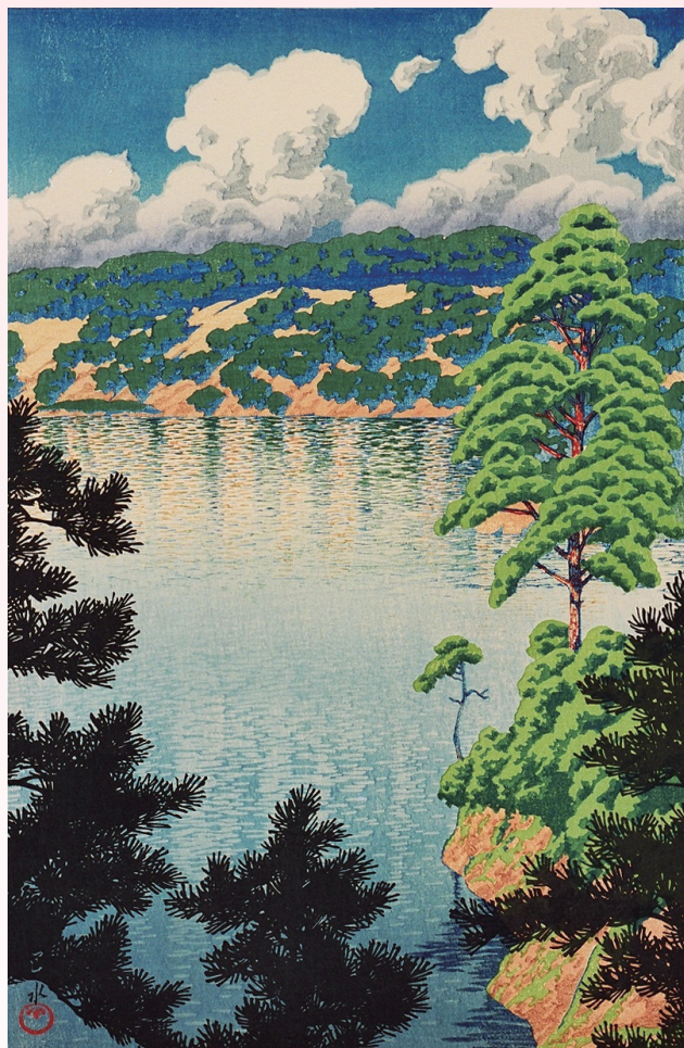
「秋田空巢沼」川瀬巴水