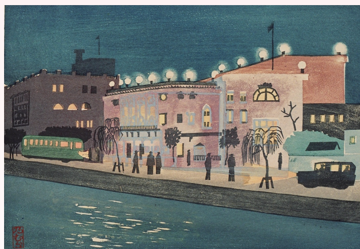
「丸の内夜景」野村俊彦