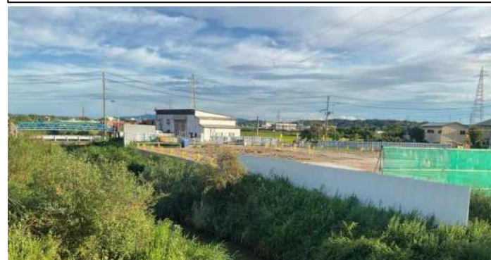
引込施設全景(土留工事着手前)

建設工事：引込施設・ポンプ場（基礎・躯体）・吐出水槽・乗り越し管 熊谷・山岡・秋田舗道建設工事共同企業体 工期：令和6年1月29日～令和8年3月23日