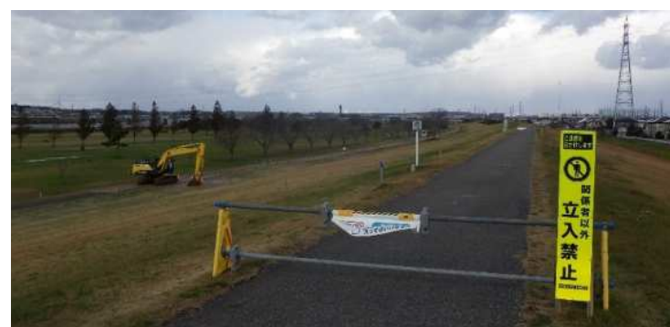
乗り越し管 工事用道路全景(ポンプ場西側)