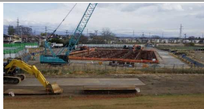
ポンプ場全景(二次掘削)