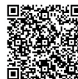
【事前申込用 二次元コード】