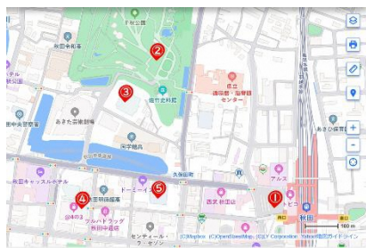
Z17LE 第1041号 【ランタンウォークスタンプ設置場所】