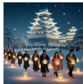
【ランタンウォークイメージ画像】 ※生成 AI 作成