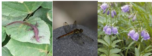
秋→ カナヘビ アキアカネ ツリガネニンジン