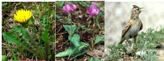
春→ ニホンタンポポ カタクリ ヒバリ