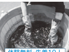
体験無料・先着10人

日時 5月25日(日)13:00～16:00 会場 秋田公立美術大学1階 染色実習室 対象 18歳以上(高校生を除く) 持ち物 染めたいもの(綿・麻)、ゴム手袋 染めたい素材を藍染めで染色(一色染め)します。希望者は、簡単な絞り染めの技法を使った模様染めも体験できます。 ■ 5月3日(土)から21日(水)まで、右のコードを読み込んで ■ 関美大事務局企画課☎(888)8478