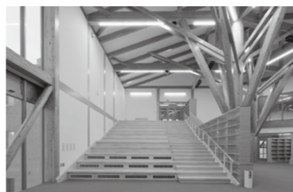
校舎の中心に配置された図書室。階段教室(写真)を通り3階に行くこともでき、子どもたちの学びの拠点となります