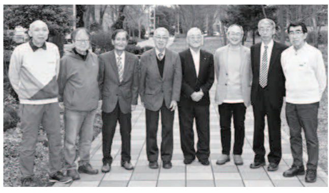
地域の絆づくりの「要」、民生委員・児童委員のみなさん

秋田市地域福祉計画は、福祉部門の基本計画として、福祉サービスの提供や住民参加による地域福祉活動推進の考え方をまとめたもので、平成16年3月に第1次計画を策定しました。 今年3月に見直した第5次計画は、令和7年度から10年度の4年間を計画期間とし、社会福祉法の改正など、刻々と変わる各種制度の変化を踏まえながら、地域福祉を推進していくための内容となっています。