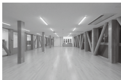
各学年ごとに設けられた学年ホール。小規模集会や少人数学習の場など、多様な学習形態に対応できるよう配慮しています