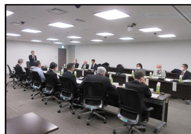
令和7年度総会の様子