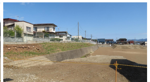
写真C 擁壁整備箇所（南側より）