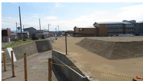
写真B 駐車場整備箇所（西側より）