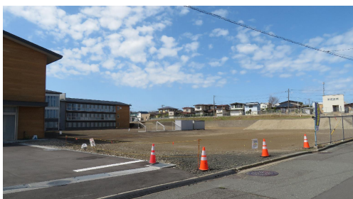
写真A グラウンド整備箇所（北東側より）